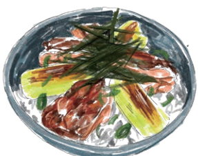
Yakitori Don 清流鶏の焼き鳥丼